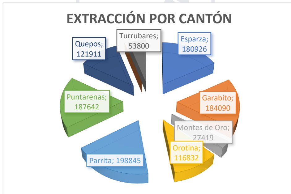
Gráfico 3. Extracción por cantón